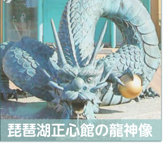
琵琶湖正心館の龍神像